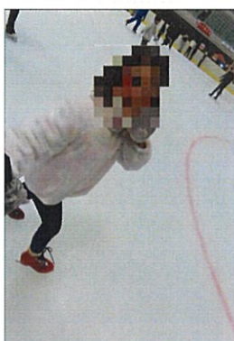
スケートしながらピース