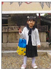
綺麗な洋服を着て

11月5日、幼児4名が道明寺天満宮さんに七五三詣の招待をして頂きました。朝から「今日は、しちごさんいくねん」とワクワクしており、いざ正装に着替えると普段はおてんばな児童もスカートをはいて、おしとやかになっていました。会場に着くと、くまのぬいぐるみが出迎えてくれ、大喜びで出来、御祈禱中は静かに待つことができました。これからも元気に育って欲しいと思います。