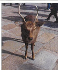
鹿がいっぱいいたよ