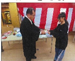
お年玉を頂きました