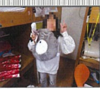
サンタさんありがとう