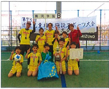
ついに近畿大会優勝!!

フットサル近畿大会 11月22日23日の2日間で神戸ユニバーシティスポーツフィールドにて第73回フットサル近畿大会が開催されました。近畿地方の各府県から予選を勝ち上がった12施設が集い、優勝を狙って闘志を燃やします。本園の児童も大阪府代表として出場しました。ほとんど代表の児童が「ワクワクする」「早くやりたい」とやる気満々です。抽選会を終え、初日の初戦の相手が小鳩の家に決まりました。チームで気持ちを一気に上げて試合に挑みます。勝ちたい思いが届いたのか、前半からトップスピードで点を取り見事13-0で勝利しました。試合後、小鳩の家の児童は涙ぐみながらも「ありがとうございます」と大きな声でしっかりと挨拶をしてやりました。そして「絶対優勝してや」と鼓舞してくれました。小鳩の家の思いも背負い、2回戦は因縁の相手である入舟寮、勝ちたい