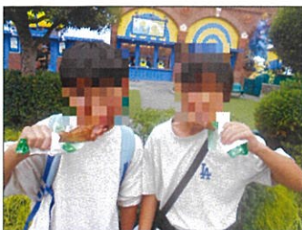
おいしいターキーレッグ

おいしいターキーレッグを食べて、笑顔で満ちた様子でした。とても充実した一日を過ごしました。