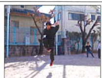
「地域の方とのつながり」

11月16日、町会行事に小学生24名が参加し、皆でドッチボールやゴム跳び、けん玉、バドミントン、卓球をしました。「好きなものから遊んで良いよ」の掛け声に合わせて一斉に移動します。けん玉やゴム跳びでは、町会の方から遊び方を教えてもらいました。卓球、バドミントンはとても人気で、順番を待っている児童も多くいました。「あと1点でおれの勝ちや」「うわー惜しかった」と全力でプレーしていました。遊んだ後は用意してお弁当を頂きました。「めっちゃ美味しかった」とあつという間に食べ終わっていました。みかんも頂き、「先生、手黄色くなった」と喜んでいました。