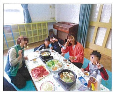
みんなで火鍋を開んで

美味しすぎ焼きに舌鼓を打った後は、ピンゴ大会です。舞台上にずらりと並んだ景品に会場から歓声が上がります。お目当ての景品を狙う闘志の炎がメラメラ。今年の一等賞は高校3年生の女の子。