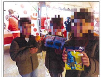
最高のグルメをいただきます