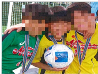
共に戦った戦友と

れません。その時、本園の児童が放った強烈なシュートが相手の体に当たりオウンゴールで先制点をとり、前半を終えます。後半こちらの鋭いボール捌きとシュートでさらに得点が入り2-0、しかし一瞬の気の緩みを突かれ点を取り返され2-1、かなり白熱した戦いとなりました。ここから本園は守りに入りそのまま試合終了、雪辱を果たし勝利する事が出来ました。