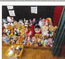
沢山の商品にわくわく

目当ての商品へと一目散に向かい、会場では次々と商品が売れていきました。購入後は「先生、これ見て! いいやろ!」「いいのが買えて嬉しい!」と、笑顔で商品を見せてくれました。また、会場では食事の準備もあり、から揚げやうどん、たこ焼き等、種類豊富なメニューが並びました。お腹いっぱい食事を楽しんだ、沢山の商品を手にした児童達の袋は、パンパンになり、笑顔が溢れていました。