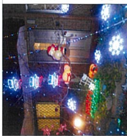
玄関がキラキラ綺麗に