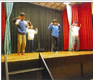
みんなでダンシング♪

幼児、低学年のグループはそれぞれが大好きなキャラクターになりきり、テーマソングに合わせて可愛いダンスを披露します。高学年はコントを交えたり、沢山の夕