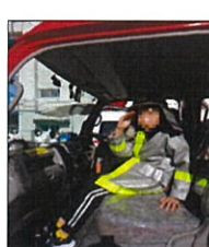
「きれいになったよ」

11月22日、国分本町7丁目1区・2区合同行事の町会防災訓練に小学生と職員が参加しました。グループに分かれて、災害時のトイレについての講義、簡易担架の作り方、消火器訓練を受けました。特に印象に残ったのが、消火器訓練でした。職員も児童も「まずピンを外して、チューブを持って...」と確認をし、今回は水の入った消火器を使って消火方法を学びました。また、最後には救急車と消防車に実際に乗りました。児童は大喜び、乗ってみると「わー広い！」、「こうなってるんや」と見て学びました。職員も「敬礼！」とカメラを向けると、児童はピシッと決め顔と敬礼ポーズを見せてくれました。