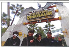
やっぱりユニバは最高!

中高生秋のレクリエーション 11月9日、中高生と職員数名でユニバーサル・スタジオリゾート・ジャパンに遊びに行きました。生憎の雨でしたがアトラクションは全て動いており、児童達は「乗ってたかったやつ動いてる!」と大喜びでゲートをくぐりまわりました。グループに分かれて、入ったすぐにエルモやハローキティ等のキャラクターが出迎えてくれ、自分達のスマホで一緒に写真を撮ったりハイテンションでスタート。その後ハリウッド・ドリーム・ザ・ライ