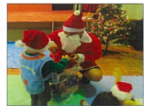
ほんもののサンタさん？

クリスマス会 夜は多目的ホールに集まり、児童職員皆でクリスマスパーティーをしました。BGMには色んなクリスマスソングが流れ、寄贈で頂いたシャンメリーを高校生が乾杯しパーティがスタート。「あれ？サンタさんは？」と司会のコールでサンタさん呼びました。現れたのは、サンタさんとトナカイです。児童や職員にお菓子の袋詰めを配ってくれて「サンタさんは忙しいから帰るね」と次の現場へ。