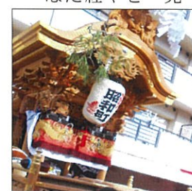
「地域の方とのつながり」

10月11日、12日の2日間、昭和町秋祭りに児童33名が参加しました。年上児童が積極的に掛け声を出し、その声に合わせて、力いっぱい地車を引きました。始めは、地車の迫力に戸惑う児童もいましたが、次第に慣れ、大きな声を出して引く姿が見られました。引き終えた後は、驚いた顔で「めっちゃ手が赤い」「筋肉痛になりそう」と話し、「頑張った証いやな」と笑顔を見せました。全員で力を合わせて、やり遂げる経験が出来た2日間になりました。